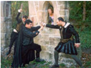
Szene aus "Ghost writing Hamlet"

Die Gruppe ACTS (Anglo-German Collaborative Theatre of Stuttgart) bietet am 30. Oktober 2003 um 19.30 Uhr für Studenten und begeisterte Theatergänger einen Präsentationsabend, der sich mit den zwei preisgekrönten multi-medialen Theaterstücken der Gruppe □ "Pricing Freedom" und "Ghost writing Hamlet" - auseinandersetzt. Die Veranstaltung findet im Rahmen eines Medientrainings statt. Gäste sind herzlich willkommen.